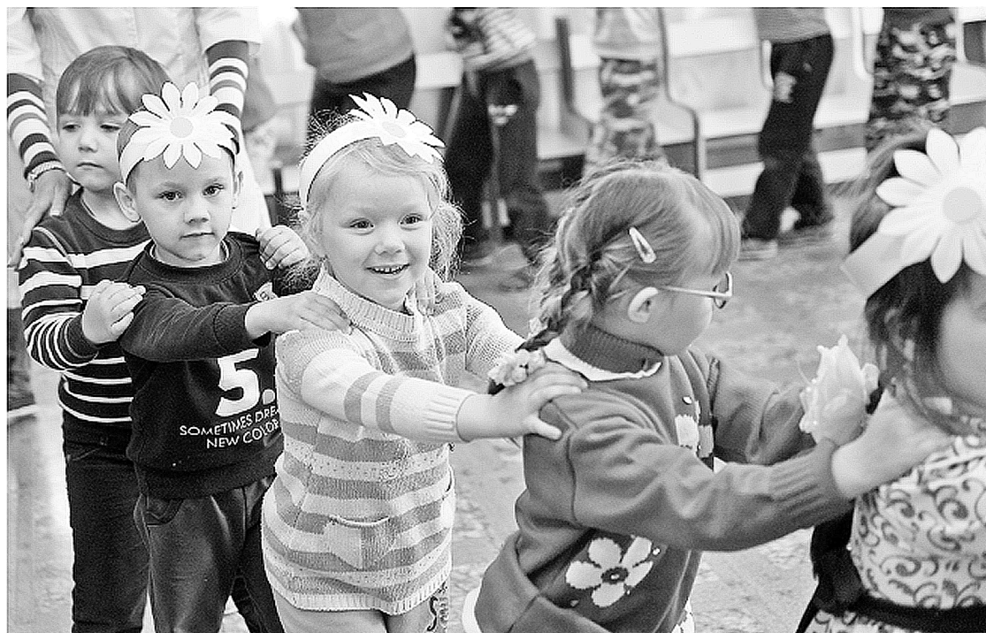
Создание условий для рождения и воспитания детей – одна из составляющих нацпроекта «Демография»

– Для нашего региона формирование позитивных демографических тенденций является первостепенной задачей,